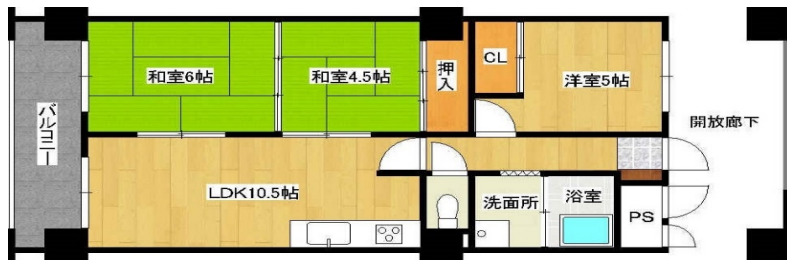
* 間取図と異なる部分は現況有姿となります。