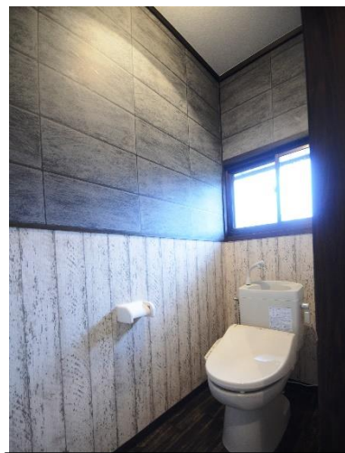
新品! 洗浄機能付の便座&便器