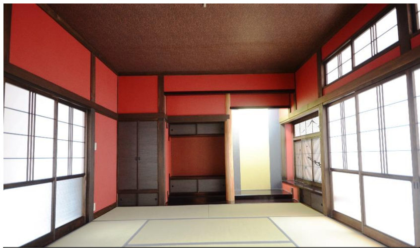
染色塗装された木部と韓紅の壁面が『粋』な【加賀の朱壁】調に 眺めた和室は書院と一間幅の広縁も備えた本格的な造りです!!

無理なく手が届く購入計画が一番安心♪見処いっぱいのお住まいです!!現地でお確かめください!!