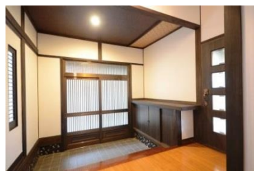
古民家風の玄関ホール!!